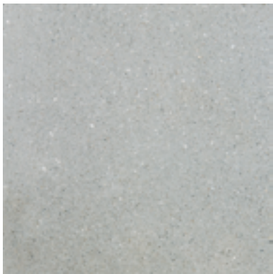
Der Objektbelag: veredelte Oberflächen mit erlesenen Natursteinkörnungen