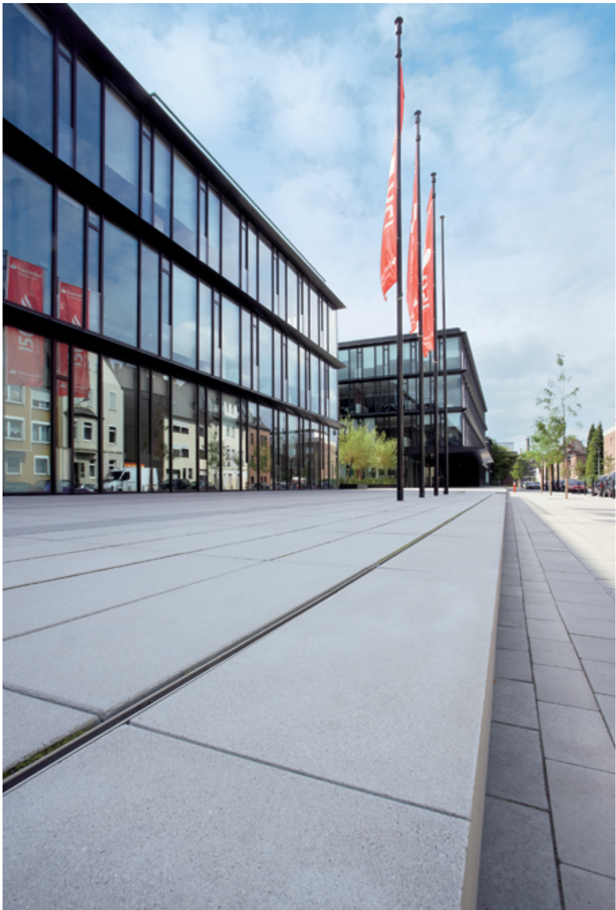
MÖNCHENGLADBACH · SANTANDER CONSUMER BANK · SCADA