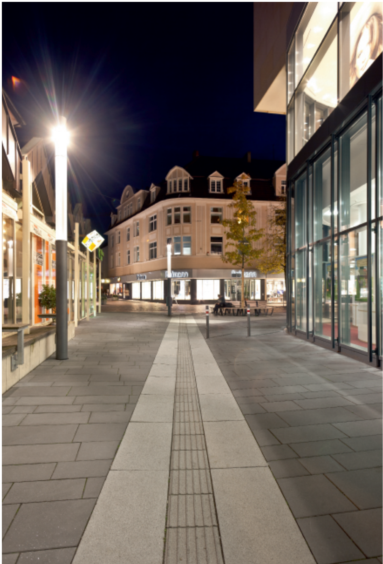
HILDEN · DR.-ELLEN-WIEDERHOLD-PLATZ · SCADA, MASSIMO