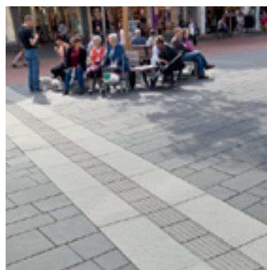
Das LED-Lichtband und Rippenplatten aus dem barrierefreien Leitsystem EASYCROSS erleichtern die Orientierung am Ort.